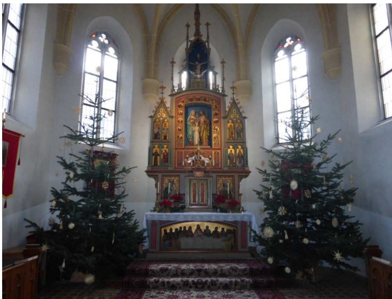
neogotischer Hochaltar „heilige Familie“ mit Weihnachtsschmuck (6. Jänner 2014)

Aufbau von unten nach oben: letztes Abendmahl, Altarmensa, Tabernakel, darüber der Aussetzungsthron, Statue Maria-Jesus-Josef (hl. Familie), ganz oben Darstellung der Dreifaltigkeit (Gnadenstuhl)