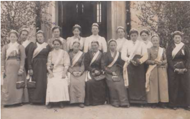
Ehrendamen anlässlich der Kirchenweihe am 26. Mai 1914 vor der Kirche in Ertl

Im „Amstettner Wochenblatt“ Nr. 20 vom 17. Mai 1914 und Nr. 23 vom 23. Juli 1914 wurde über die Weihe der neuen Kirche, des Hochaltars und der Orgel in Dorf St. Peter berichtet: