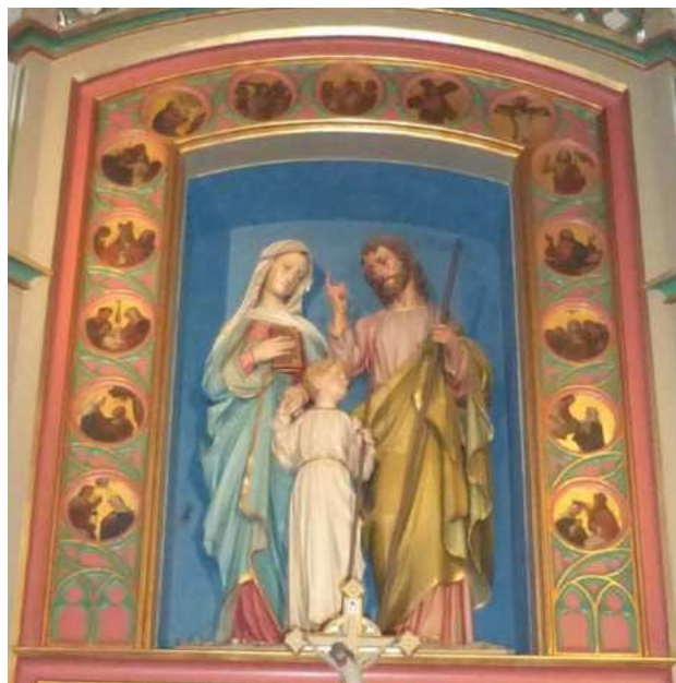
Statue der hl. Familie am Hochaltar, umgeben von Medaillons mit den Rosenkranz-Geheimnissen

„Das Stiftskapitel ist bereit, die Gründung einer neuen Pfarre Ertl dadurch zu fördern, dass es einen entsprechenden Teil der Pfarre St. Michael a. B. an die neu zu gründende Pfarre Ertl abtreten will. Dagegen erklärt sich das Stiftskapitel außerstande, für die Gründung der geplanten Pfarre die bisherige Pfarre St. Michael ganz unterdrücken zu lassen und auf jedenfall außerstande, die neue Pfarre Ertl zu übernehmen.“