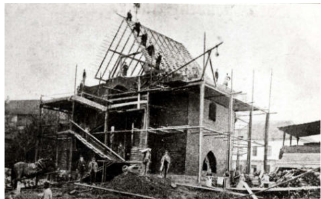
Bau des Chorraumes und Errichtung des Dachstuhles (ca. 1901)