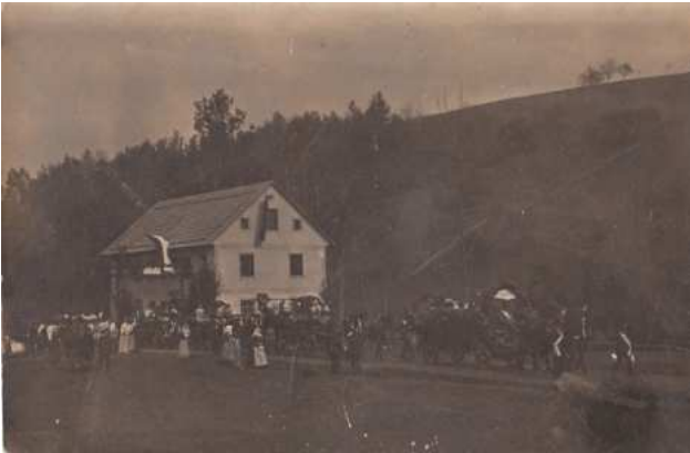
Einzug der Festgäste zur Kirchenweihe am 26. Mai 1914 vor dem Gasthaus Schlager

Während der Messe wurde zum ersten Mal die Orgel gespielt, ein Werk des Matthäus Mauracher aus St. Florian (Preis: 5000 Kronen). Zu Mittag wurde der Bischof vom Kirchenbauverein zum Festessen ins Gasthaus Schlager eingeladen.