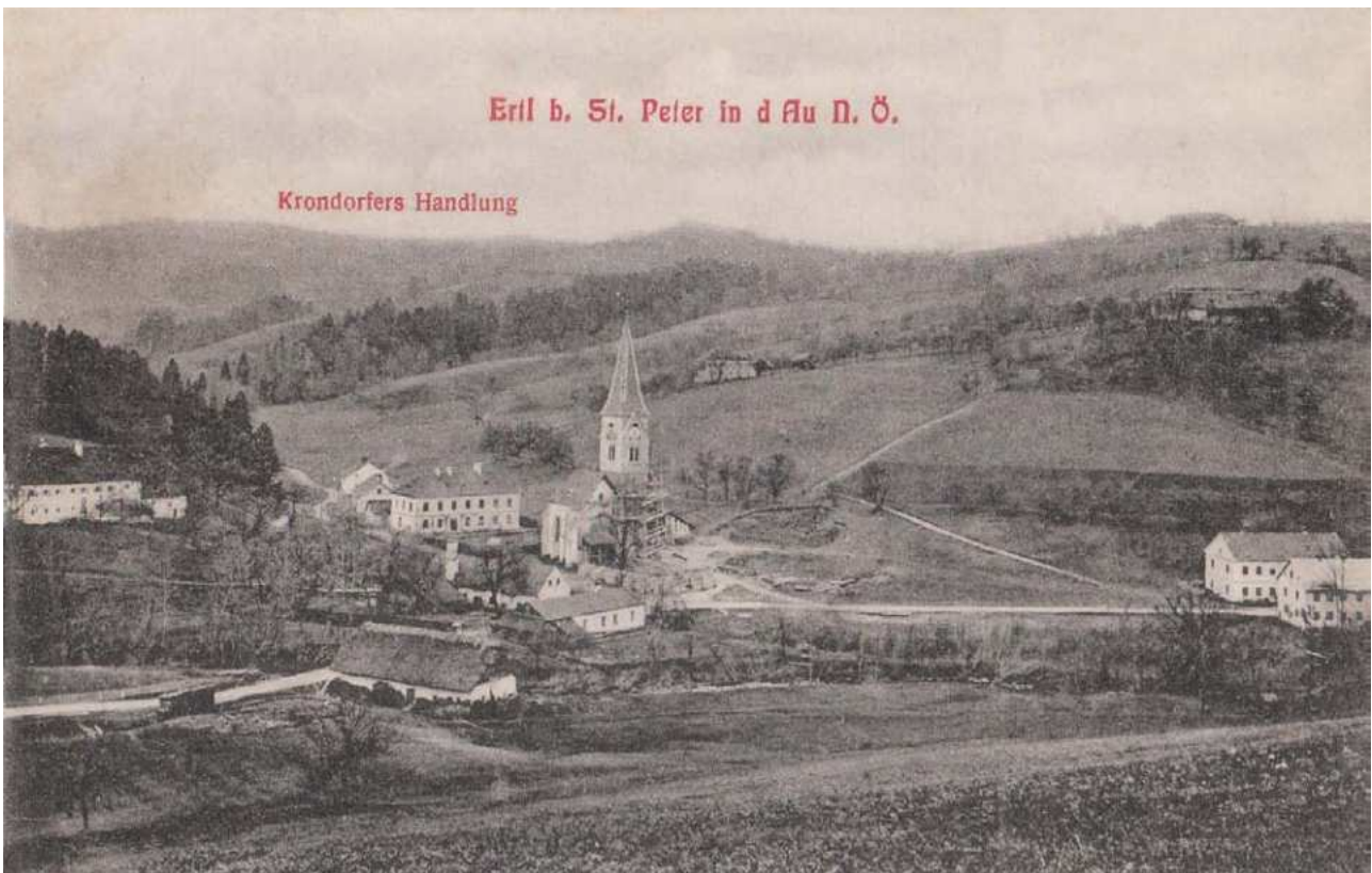
Blick auf die „Dorfkapelle“ samt Turm (ca. 1909)